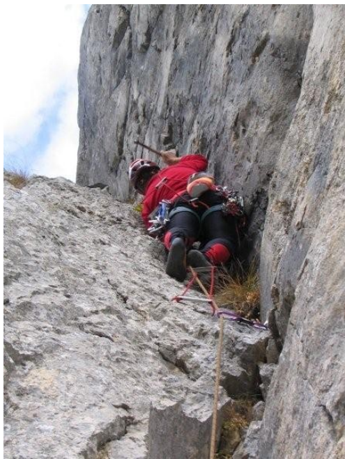
Šprana v plotu