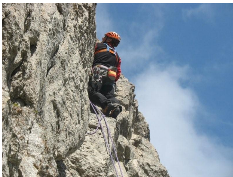
vstop v Lastovičji rep